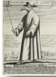
Resim: 5. 1656 Dr. Schnabel von Rum. Paul Furst tarafından yapılan hiciv gravürü.

12. Geri kalanı için sadece dua etmelisin. 7