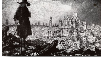
Resim:1. 1666 yılında veba ve ateşten sonra Londra 3

Londra büyük fırsatların, aktüel kültürün ve çok çeşitli eğlencelerin mekânı haline geldi. Geçici olarak savaş yoktu ve işsiz askerler de başkente akın etti. Şehrin nüfusu bir şekilde neredeyse bir gecede 100 bin kişi arttı.(1665"Samuel Pips Günlüğü")