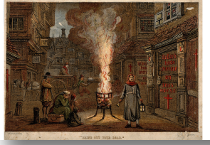
Resim: 6. 1665 Büyük Londra Vebası; İllüstrasyon, Güzel Sanatlar Görüntüleri / Miras Görüntüleri; Getty Images /

İnsanlık tarihinin farklı aşamalarında, her biri görsel sanatların canlı bir şekilde tepki verdiği, büyük ölçekli salgınlar tarihi biçimledi.