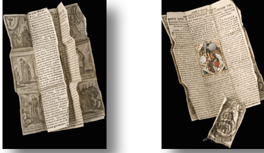
Resim: 4. 1690-1710 Vebadan korunma yollarını anlatan Latince kural ve öneri kılavuzu

10. Son olarak, vebanın geldiği şehirde kalmak, salgının yayılmasıyla birlikte gelen soygunculara dikkat etmenizi zorunlu kılar. Soyguncular altın çağı yaşıyor. Evinizin kapılarını kilitli tutun, kazara soyguncuların kurbanı olmamak için yanınızda herhangi bir değerli eşya taşımayın.