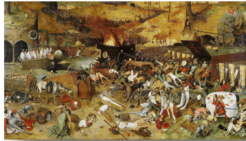
Resim: 7. 1526, Yaşlı Peter Brueghel. Ölüm Zaferi. Fragment. Prado, Madrid