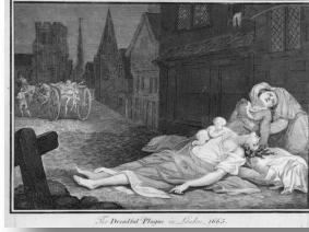
Resim: 3. 1665 Veba Zamanında Londra Sokakları 5

Pencerelerimden kasapların yerleştiği yeri, kasaplara bağlı iş yerlerini görebilirsiniz. Ve gecenin neredeyse tüm karanlık zamanlarında, ölümlerle dolu araba, sokağın sonunda durdu ve dolu gitti. Ve kilise bahçesi çok uzak değildi. Sonra yakında yeni bedenler almaya geldi. "Öyleyse, övgü senin için olsun Veba! Karanlığın mezarından korkmuyoruz"(Defoe 1722, "Veba Yılı Günlüğü")