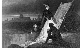
Resim:2. 1885 “ Bir veba mezarlığında gece vardiyası” atılır 4

Kraliyet mahkemesi, Mayıs 1665'te Londra'dan Oxford'a taşındı. Yakında zengin varlıklı Londralılar da eşyalarını ve evcil hayvanlarını toplayıp açık havaya çıktılar. İster gönüllü ister istemeyerek ölümü, ya da sevdiklerini kaybetmeyi beklemeye devam edenler çoğunlukta idi. (Defoe 1722, "Veba Yılı Günlüğü")